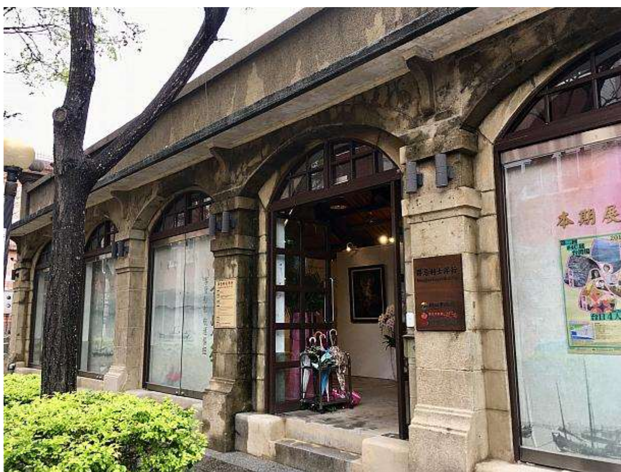
淡水老街を奥に奥に行った得忌利士洋行（ダグラス洋行）が会場、5/5までの開催期間です。お互いのアートや感性に共感し、4人が集まり展開される#4C展、ぜひ足を運んでみてください！！

得忌利士洋行（ダグラス洋行） 新北市淡水區中正路316號 02-2629-9522 9:30～17:00、土日は～18:00（4/1のみ休館）